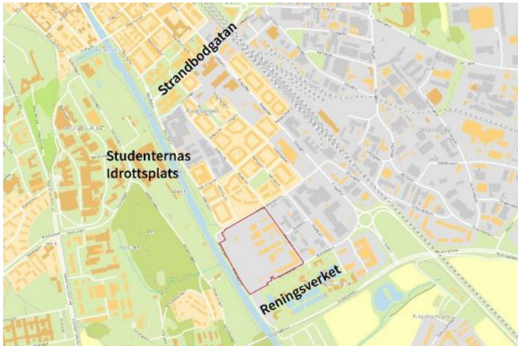
Planområdet markerat med rött