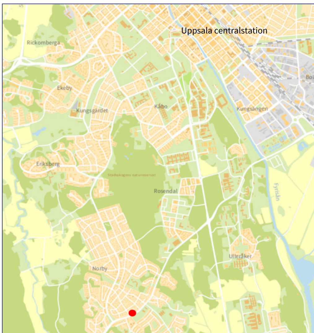
Bild 1. Orienteringskarta som visar fastighetens läge med en röd prick.

Fastigheterna Norby 100:4, Norby 100:5 och Norby 100:10 är runt 1 500 kvadratmeter vardera och är en del av stadsplan Norby-Valsätra (aktbeteckning 0380-208) och ligger i kvarteret Haglet. Fastigheterna ägs av privatpersoner.