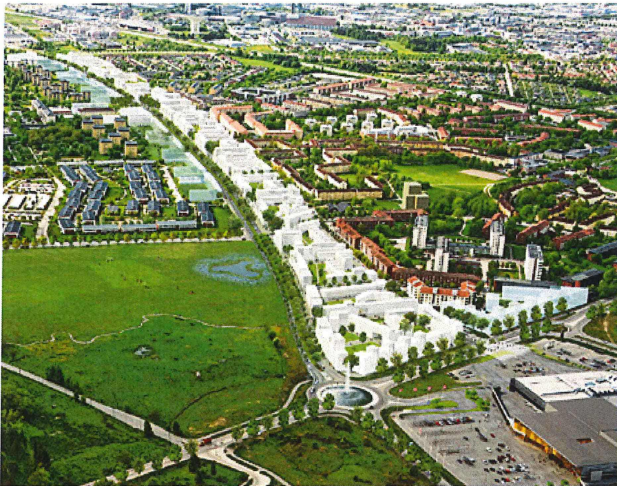
Östra Sala backe länkar samman Årsta och Sala backe.