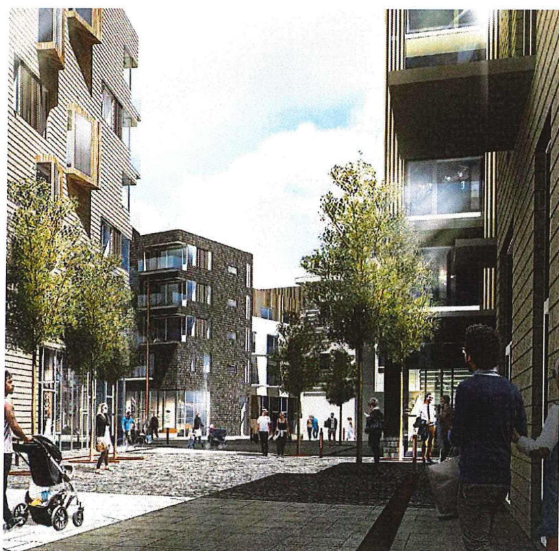
Juul & Frost Arkitekter 2016