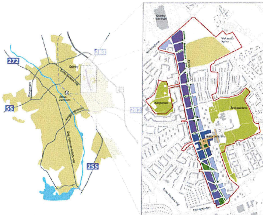
Illustration över Östra Sala backe