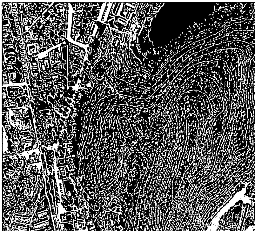
Bild 6: Planområdets läge i förhållande till friluftsområdet på Sunnerstaåsen.

Sunnerstaåsen med motionsspår, skidbacke och närkontakt med Fyrisån ligger bara ett stenkast från planområdet. Grönområdet försörjer hela Sunnersta vad gäller rekreativa miljöer men vintertid och i snötider även stora delar av Uppsala stad. Mycket goda möjligheter finns att längs med ån cykla eller promenera både in till Uppsala och söderut från Sunnersta på bra grusvägar.