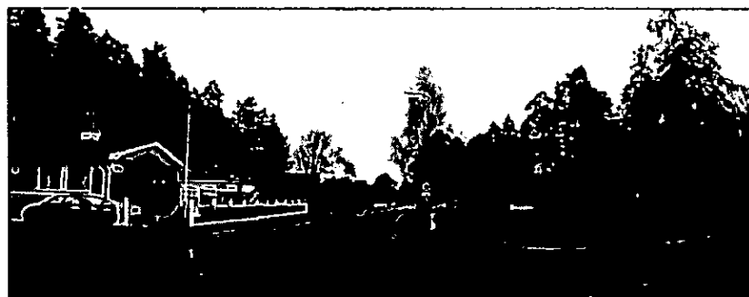
Bild 5: Sunnerstavägen med område för föreslagna tomter till höger och Sunnerstaåsen till vänster.