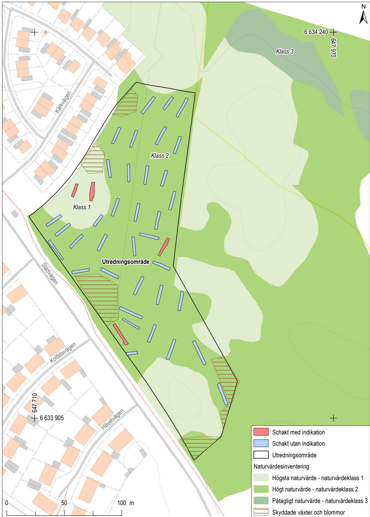
Figur 2. Den arkeologiska utredningen begränsades av att området innehöll höga biotopvärden. Mot bakgrund av Fastighetskartan (exklusive markslag), skala 1:2 000.