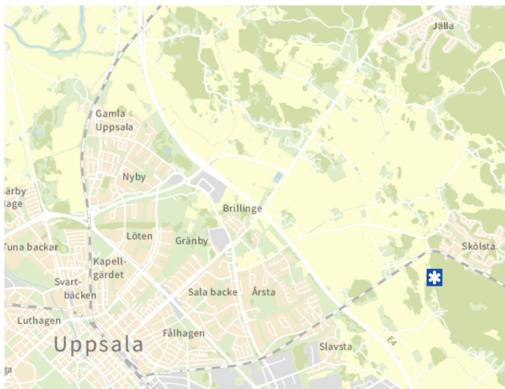
Kartbild över Uppsala med markering av geografisk placering av Vedyxaskogens naturreservat.

Reservatsbildningen innebär inga ytterligare förvärv utan endast nedskrivning av markvärden på redan kommunalägd mark. Total nedskrivning är 0,5 miljoner kronor.