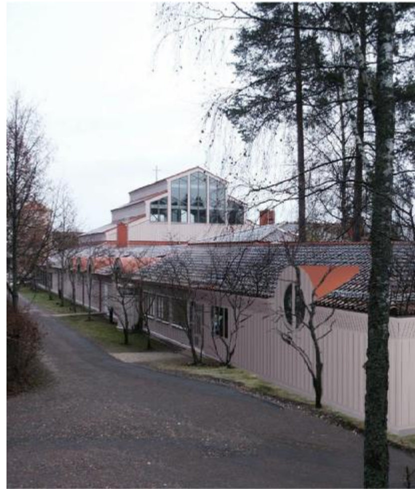
Perspektiv efter (Nyréns Arkitektkontor, Stockholm)