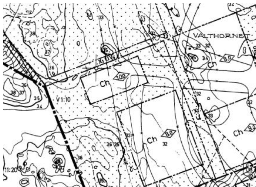
Utdrag ur gällande detaljplan Dp 84 E