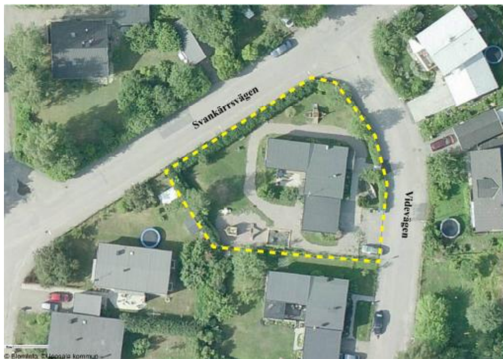
Planområdet markerat med gul streckad linje.

Fastigheten Sunnersta 104:15 har använts till förskoleverksamhet sedan 1988 och är bebyggd med en byggnad i en våning. Idag hyr Videungens montessoriförskola lokalerna och på tomten finns en mindre lekplats och en del växtlighet. Inom tomten finns parkeringsmöjligheter för cyklar och två bilar.