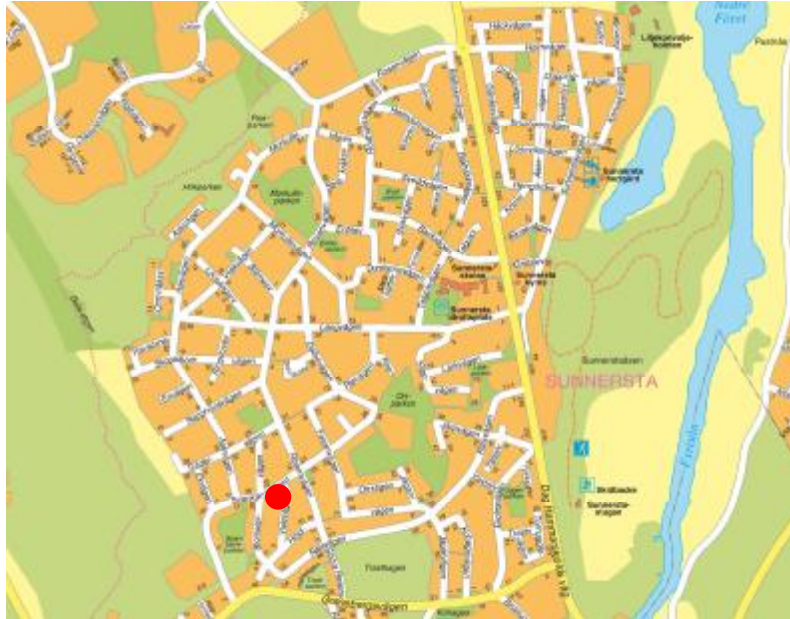
Översiktskarta med planområdet utmärkt i rött.