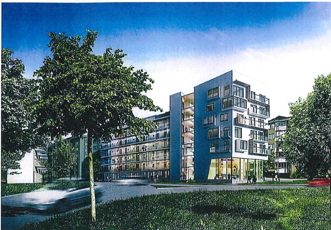
Illustration som visar planerad bebyggelse, sett från Råbyvägen. (White Arkitekter)