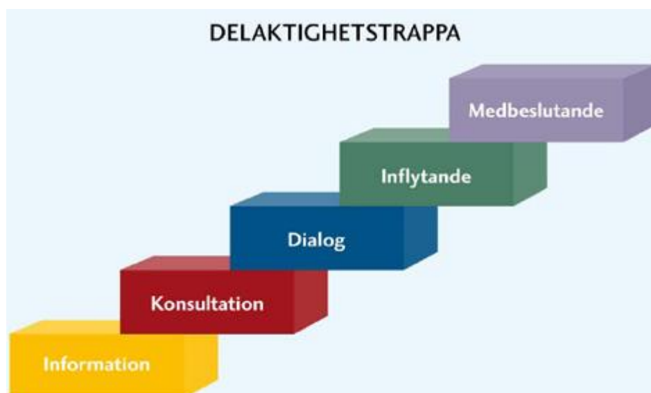
Figur 1 Delaktighetstrappa SKR. En trappa som beskriver olika nivåer av inflytande.

För att delaktighet och inflytande ska kunna ske på ett effektivt och jämbördigt sätt är det viktigt att brukare eller brukarrepresentanter bjuds in till samarbete innan en struktur byggs upp. När kommunens tjänstepersoner och politiker tillsammans med brukarorganisationerna tar fram strukturer och rådgivande organ ökar möjligheten till positiv utveckling av kommunens arbete med ökad delaktighet. Nationell samverkan för psykisk hälsa i Göteborg (NSPHIG) har i sin handbok i brukarinflytande (2020) tagit fram ett metodstöd, en steg för steg-modell. Modellen kan med fördel användas för dem som vill organisera ett systematiskt arbete i syfte att stärka inflytande för brukare och brukarorganisationer.