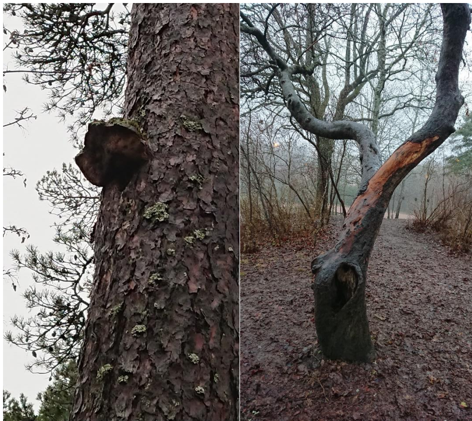
T.v. Talticka på tall (nummer 27).