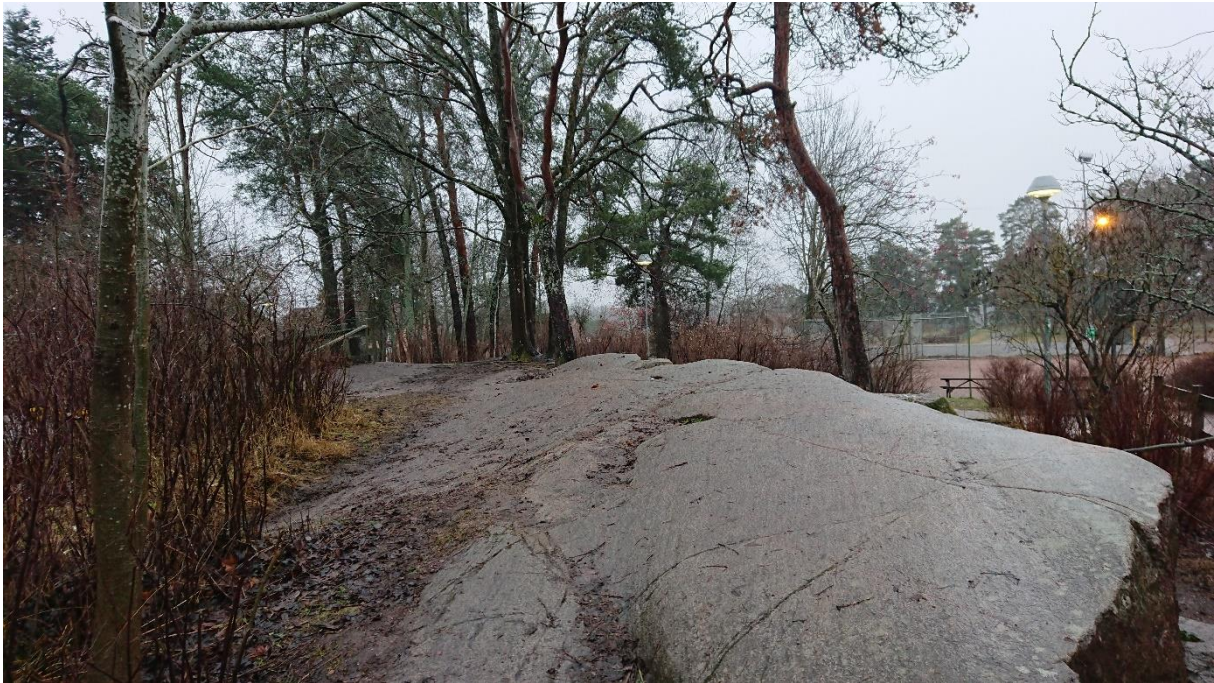
Figur 2. Klipphäll strax öster om skolbyggnaden med äldre tallar i bakgrunden.