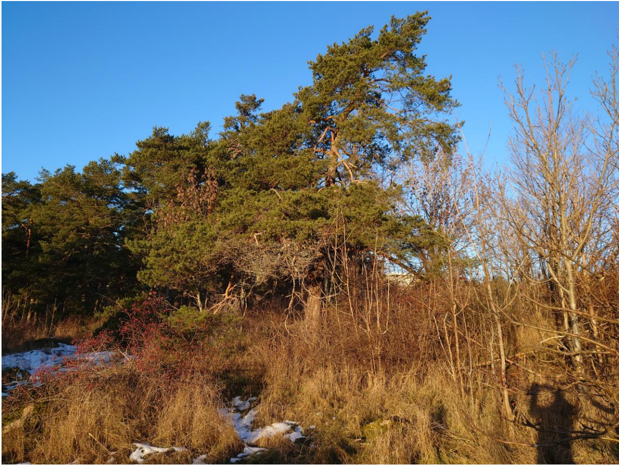
Figur 1. Skogbestånd mellan bilväg i öster och cykel/gångväg i norr/väster samt gräsmatta i söder, som utgör en del av tallskogen kring Flogsta höghus.