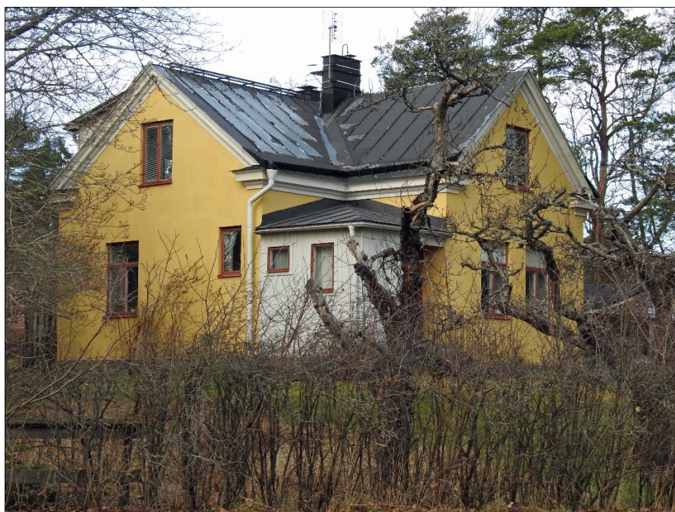
Fasad mot öster.

Enligt uppgift i Sveriges Bebyggelse, ett bokverk från omkring 1950, moderniserades byggnaden 1943. Möjligen kan den västra långsidans utsträckta takkupa och balkong ha utförts vid detta tillfälle, men det kan också ha skett något senare. I Sveriges Bebyggelse anges nämligen att byggnaden endast har tre rum, kök samt två hallar. Själva byggnaden var i privat ägo och värderades till 15 000 kr, men marken ägdes av Upsala-Ekeby AB.