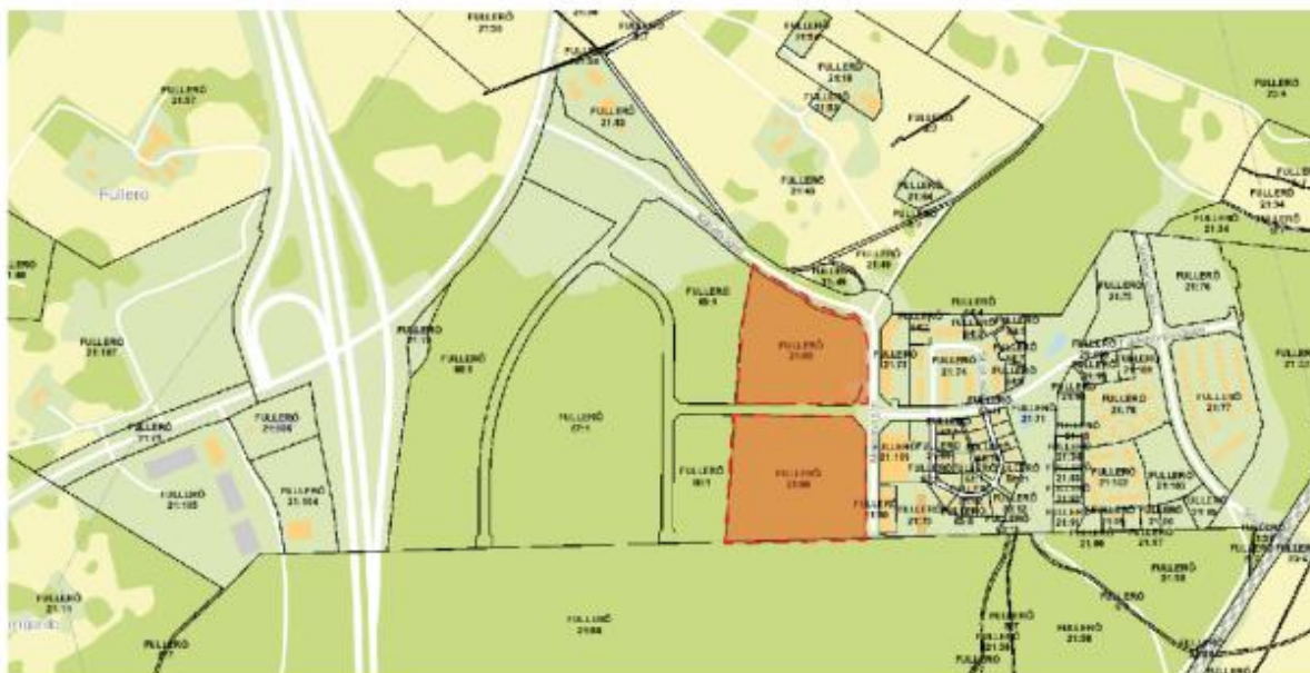
Figur 4 Planområdets läge i Fullerö, markerat i rött.