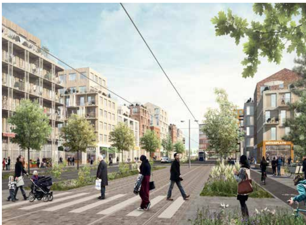
Stadsstråket med spårväg och ny bebyggelse blir en ryggrad genom Gottsundaområdet.

I Gottsundaområdet finns idag ett väl utbyggt nät av gång- och cykelvägar i parkmiljöerna. Dessa kommer att finnas kvar i framtiden. Samtidigt kommer nya stråk koppla ihop viktiga platser med områdets olika bostadsområden, både befintliga och nya. Stråken ligger oftast i anslutning till bebyggelse och kan upplevas som ett tryggt transportalternativ, exempelvis under kvällen.