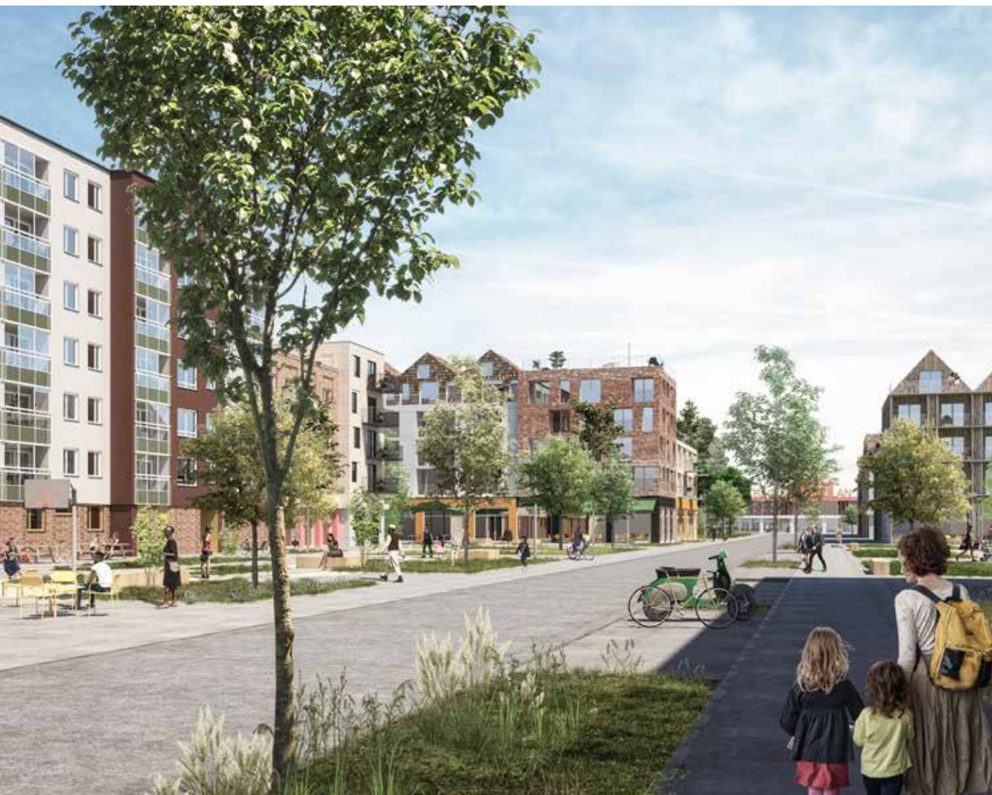
Befintlig och ny bebyggelse möts på Bandstolsvägen. Gaturummet öppnas upp mot Bäcklösaskolan och skapar liv och flöden av människor på platsen som idag är en vändplan med parkeringar.

Kommunen har även tagit fram en handlingsplan för ett socialt hållbart Gottsunda och Valsätra. Handlingsplanen behandlar många olika utvecklingsfrågor inom områdena hållbar livsmiljö och trivsel, trygghet, barn och ungas uppväxtvillkor, arbete och delaktighet. Handlingsplanen tar hand om insatser och aktiviteter som kommunen planerar att genomföra på kort och lite längre sikt. Läs mer om handlingsplanens fokusområden och koppling till planprogrammet i bilagan Handlingsplan Gottsunda/Valsätra: Fokusområden – stadsutvecklingens sociala synergier .