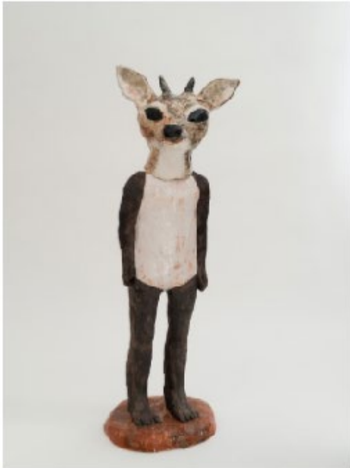
Hjort 2014 keramik