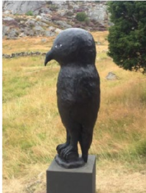
Bird Girl 2019 Brons