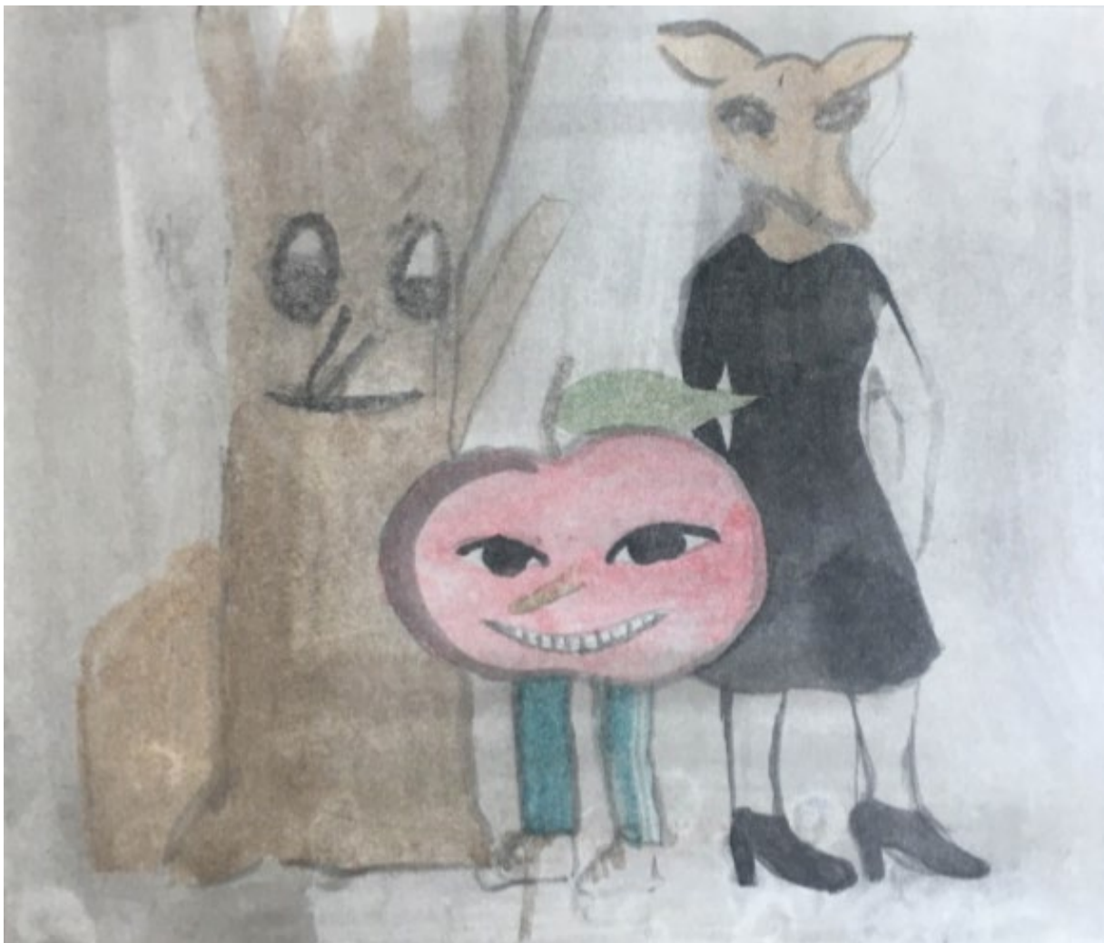
Skiss till Valsätraparken

Detta är en grupp ursprungligen ritad för en tävling i Växjö där temat var invandring och jag valde att göra en liten familj, inspirerad av min egen men den behöver inte läsas som det. De skulle lika gärna kunna vara porträtt av tre olika individer, karaktärer och sinnesstämningar, Pappa träd, stabil och lite inåtvänd, mamma mer utåtriktad som ett rådjur på väg ut och äppelbarnet, full av entusiasm. Det finns även en resväska med för att förstärka känslan av några som anlant någon annanstans ifrån eller är på väg någon annanstans. Just nu har de stannat till här. Var och en av oss skulle kunna vara en av de tre på stenen, eller alla tre på en gång. En tanke är att vi är främlingen, främlingen är vi och i det mest udda finns en del av oss. Den är lekfull och allvarlig på samma gång. Jag har tänkt på platsens karaktär men även de olika befolkningsgrupper som möts där. Gruppens skala är tänkt att inbjuda till nåt slags umgänge med skulpturerna och inte endast ett betraktande även om de fungerar bra så också.