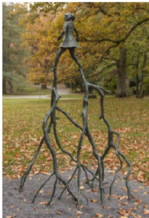
Dei som håller mig kvar bär mig vidare