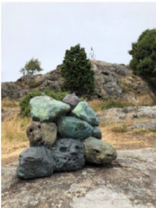
Röse 2011 Brons