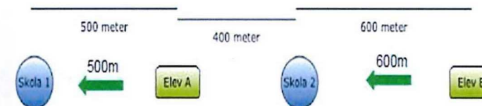
4.) Relativ närhet till Skola 2: Elev A - Om elev A inte får gå på skola 2 får den 100 m längre skolväg (500 - 400). Elev B : Om elev B inte får gå på skola 2 får den 900 m längre skolväg (1500 - 600).