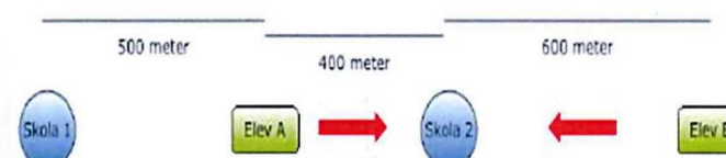
2.) Elev A och Elev B söker båda till Skola 2, som bara har en plats.