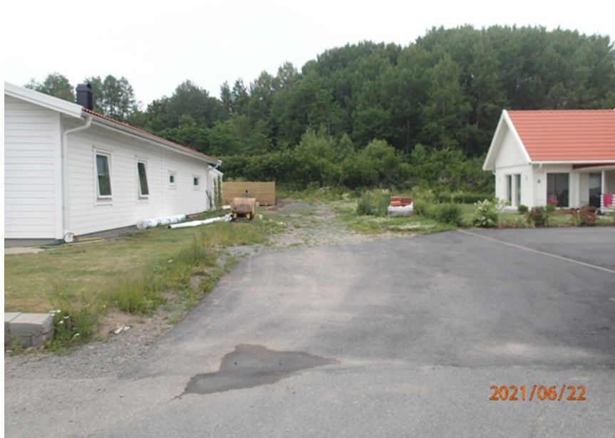
Bild 3 Blivande infart till området