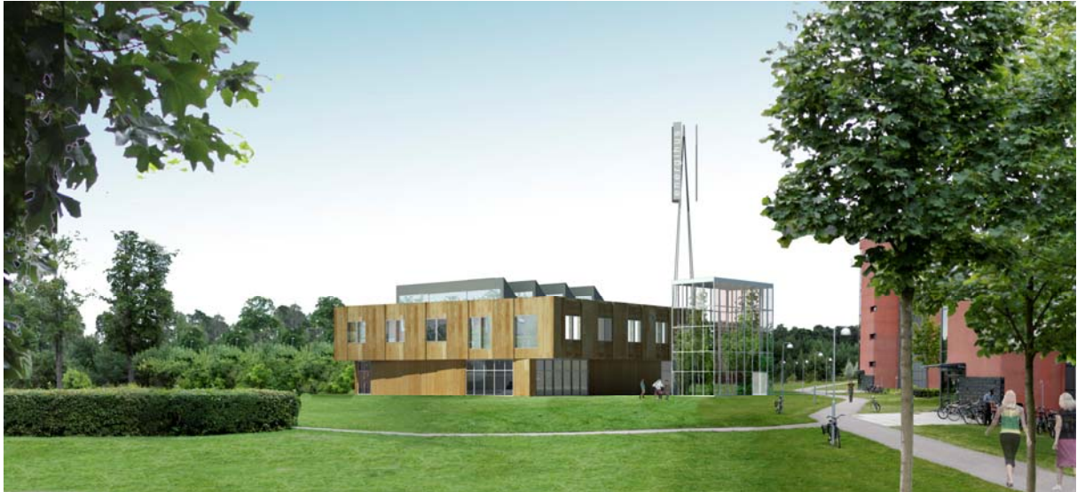
Energihuset sett från norr. Till höger entrén med vinterträdgården.