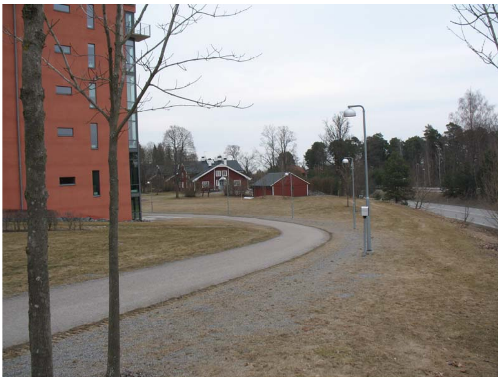
Planområdet sett från sydväst. Underofficersvillorna i bakgrunden.

Byggnaden kommer att påverka stadsbilden främst sett från Kungsängsleden. Norr om planområdet ligger Underofficersvillorna som har kulturhistoriska skyddsbestämmelser (q) i gällande detaljplan.