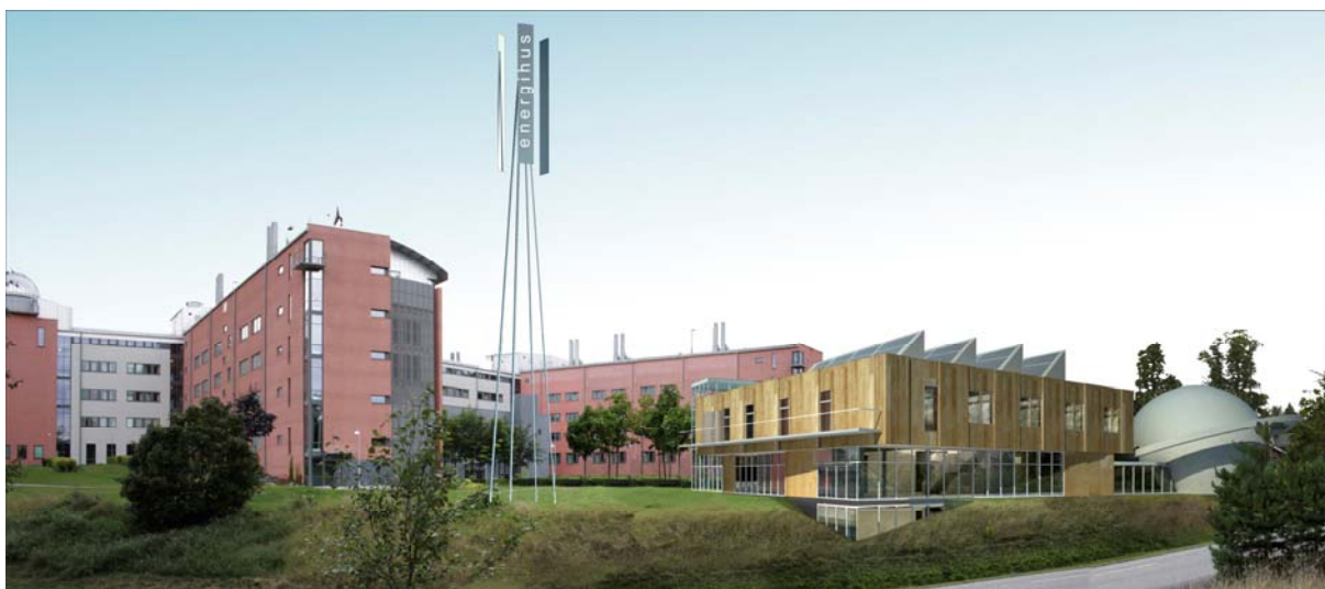
Energihuset, med planetarium, sett från sydöst. Kungsängsleden i förgrunden..