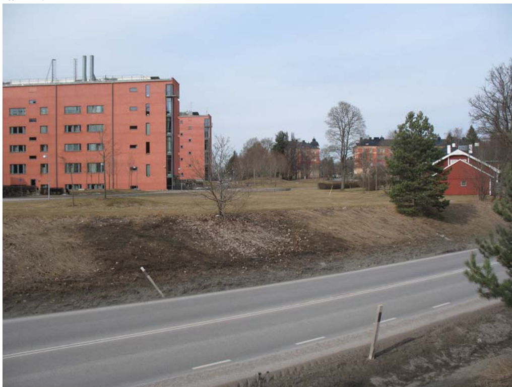
Planområdet sett från söder. Kungsängsleden i förgrunden. Ångströmlaboratoriet i vänster bildkant.

Marken, som ingår i fastigheten Kronåsen 7:1, ägs av Akademiska Hus Uppsala AB.