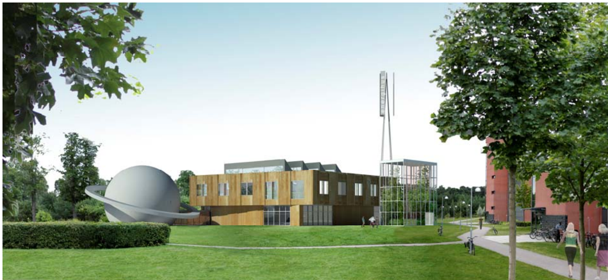
Energihuset, med planetarium, sett från norr. Till höger entrén med vinterträdgården