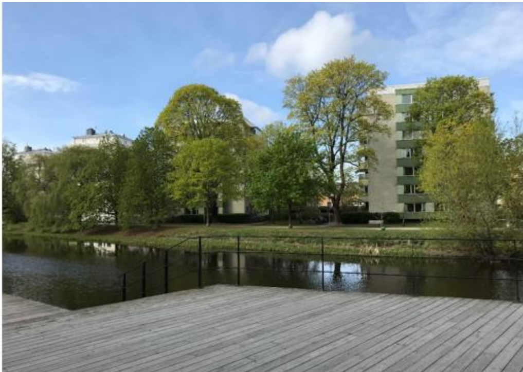
Bild på punkthuset från andra sidan Fyrisån