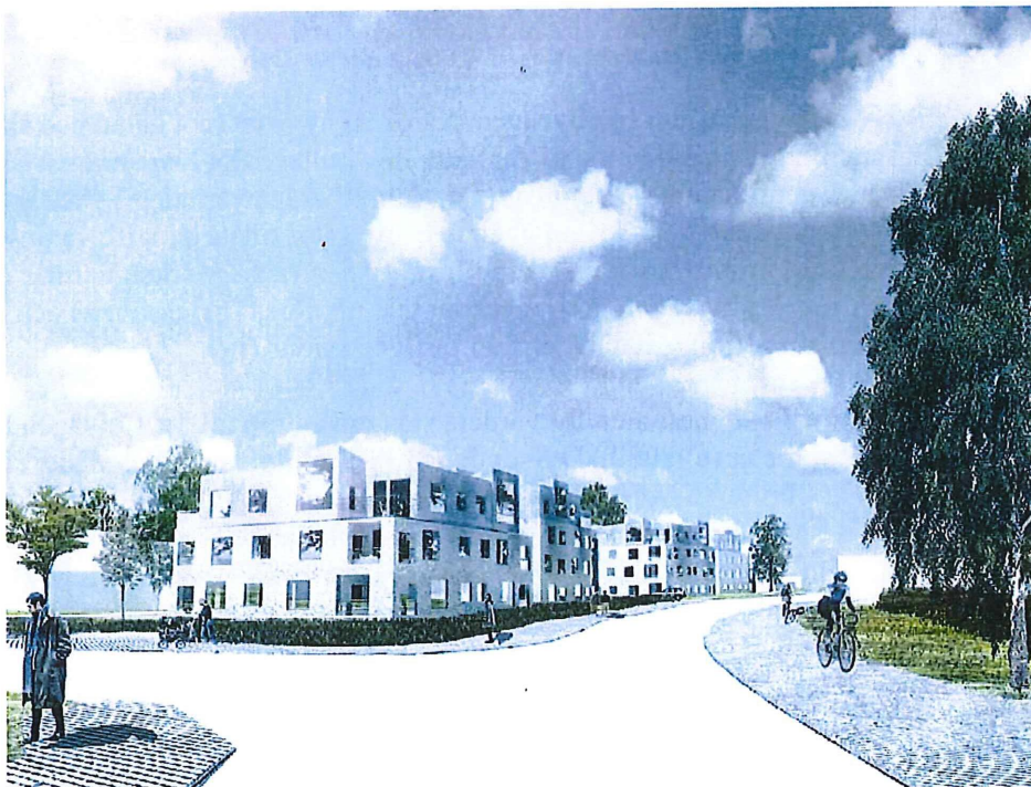
Illustration som visar flerfamiljshuset sett från söder längs Norbyvägen.