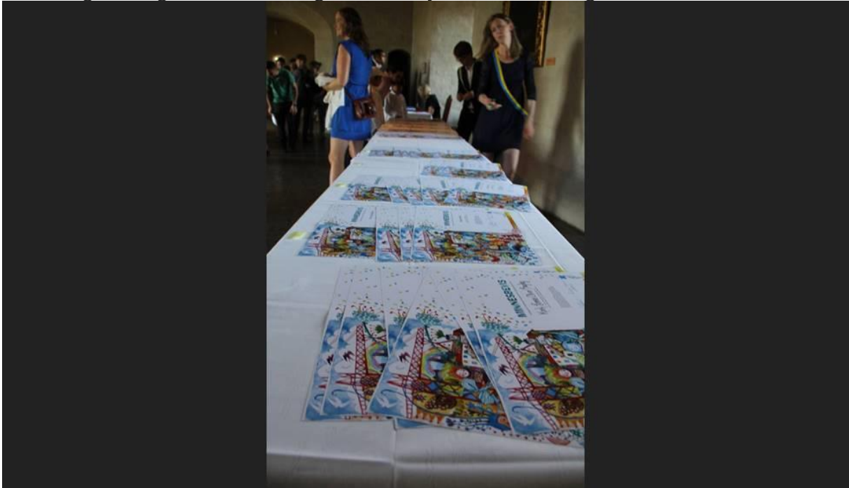
Minnesbevisen låg på rad och väntade i slottet.

om sin egen bakgrund som immigrant från Tyskland efter kriget.