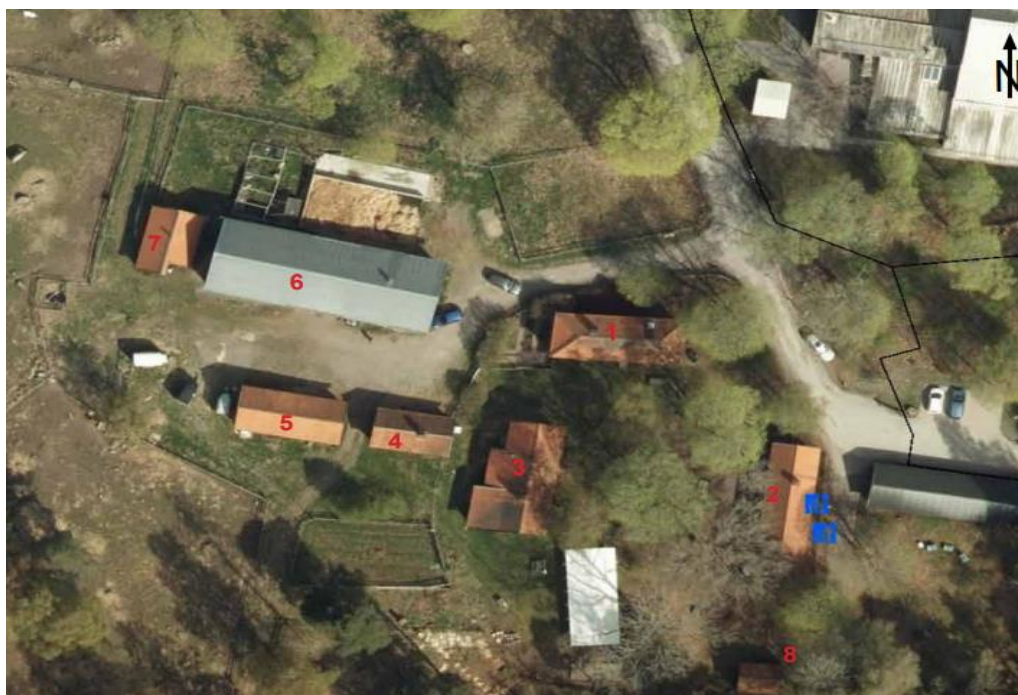
Kartbild över befintliga byggnader på Linnés Sävja