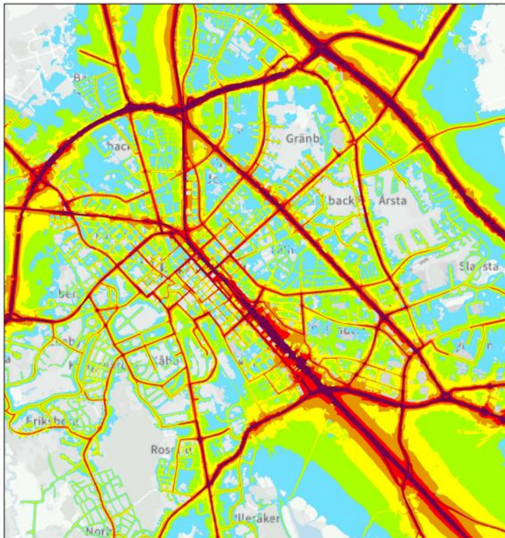
Figur 1. Utdrag ur utbredningskarta Leq väg och spårtrafik sammanslaget