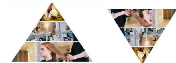
Figur 1: Näringslivsanalysen beskriver nuläget i dag i Uppsalas näringsliv och påvisar styrkan samt relationerna för hållbar tillväxt mellan de olika delarna i näringslivet. Näringslivsanalysen uppdateras löpande.

I Uppsala kommun fanns 115 500 jobb i november 2022 varav cirka 60 procent i privat sektor. Den senaste tioårsperioden har drygt två 2 000 jobb skapats per år varav cirka 65 procent i privata näringslivet.