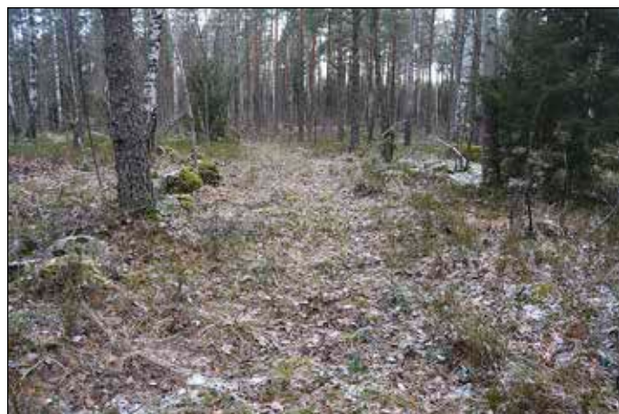
Fig 4. Obj 2 - färdvägen syns som stenröjd köryta med röjd sten på sidorna.

Obj 3: Terrasserings, ca 25x12 m (ONO-VSV) och upp till 1 m hög. Den var tydligast och högst i västra delen. Övertorvad med relativt rikligt med stenar synliga i kanterna och i ytan. Beväxt med unga björkar, asp och enstaka unga granar samt sly. Oklar status varför en utredning etapp 2 föreslås.