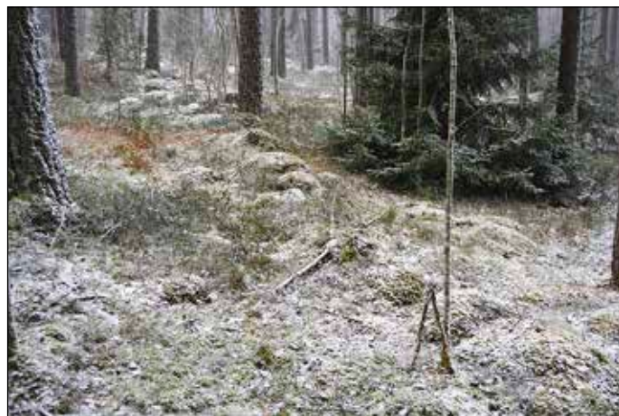
Fig 7. Obj 7 - stensträngen framträder tydligt i pudersnön.