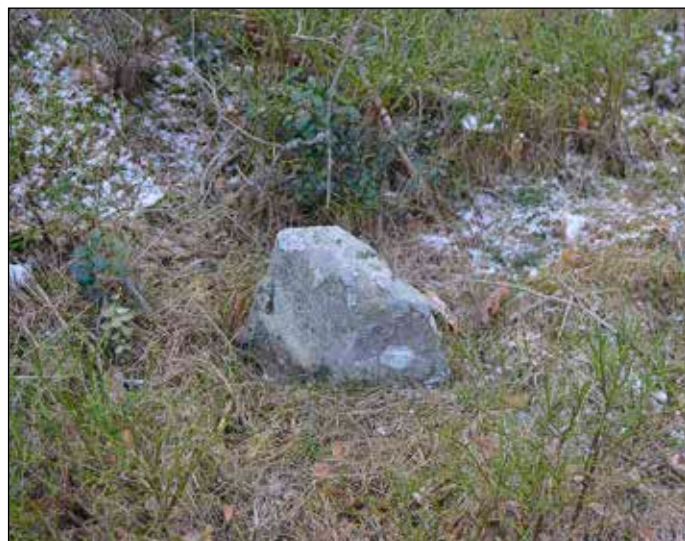
Fig 3. Obj 1 - gränsmärke i form av en visare.

Obj 2: Färdväg, markväg, ca 110 m lång (VNV-OSO) och 3 m bred med mer eller mindre sammanhängande röjningsvallar av sten längs bägge sidorna. Vägen var övertorvad och vallarna övermossade till övertorvade (fig 4). Vägens västra ände oklar pga dumpmassor. Kan ej återfinnas på kartor. Lämningsbedöms, utifrån utseende och karaktär vara en övrig kulturhistorisk lämning.