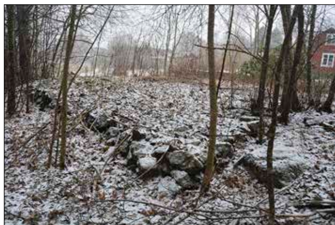
Fig 6. Obj 6 - tydlig husgrund i lätt pudersnö.