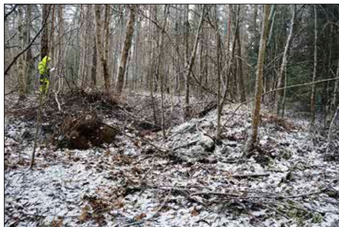
Fig 5. Obj 5 - Jordkällare med ingång samt Kjell som beskriver.

De sedan tidigare registrerade lämningarna inom utredningsområdet har nu kontrollerats i fält. Lämningarna L1940:7279 (Lena 573), L1940:5337 (Lena 538), L2019:3916 och L2019:3917 stämmer bra med beskrivningarna i Forndok.