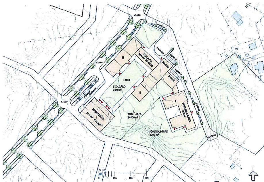
Illustrationsplan över skola och förskola