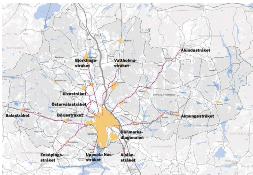
Figur 2. Utpekade framtida cykelstråk på landsbygden.

Ett ytterligare sätt att öka den regionala cyklingen är att underlätta för intermodala resor, främst för kombinationsresor mellan cykel och kollektivtrafik. Det finns också möjligheter att öka den regionala pendlingen genom att på olika sätt uppmuntra fler att cykla med elcykel.