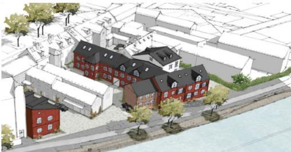
Bild på möjlig utformning av kvarteret