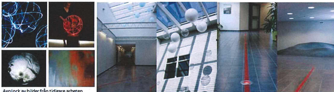
Axplock av bilder från tidigare arbeten