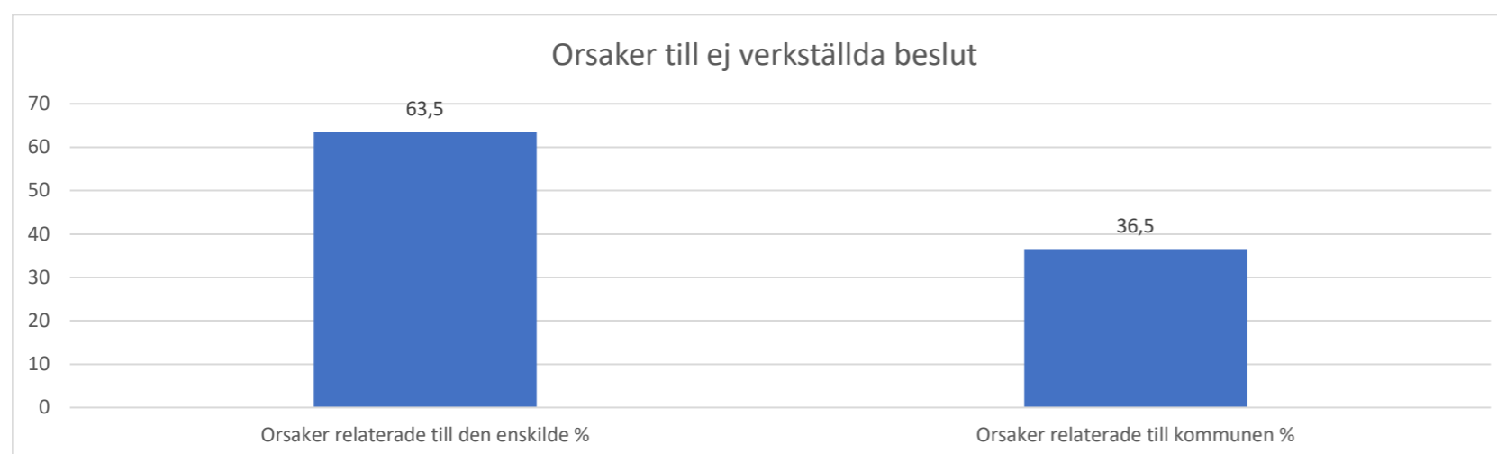
Tabell 7. Orsaker till ej verkställda beslut, sammanställt

Kommentar till tabell 7: Orsaker relaterade till den enskilde är att hen har specifika önskemål om verkställighet, att hen inte medverkar till verkställighet, att hen tackat nej till erbjudande, att hälsotillståndet har varit ett hinder etc. Orsaker relaterade till kommunen är t ex att det saknas plats eller personalrelaterade skäl.