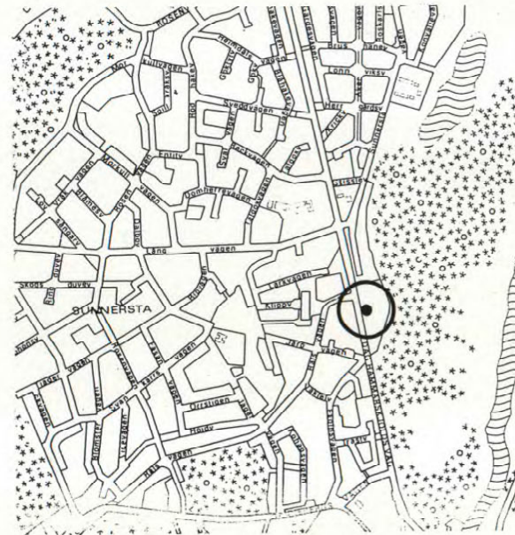
Översiktskarta skala 1:15000.