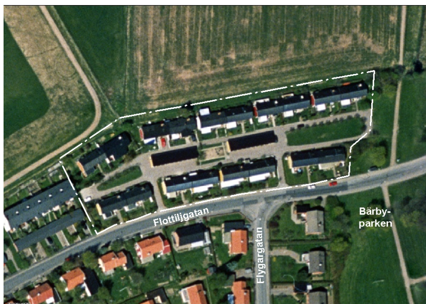
Flygbild som visar omfattningen av planförslaget och byggnadernas läge.

Planförslaget lägger fast det faktiska läget av byggrätterna av sammanbyggda hus i en våning. En bestämmelse om högsta byggnadshöjd, 3,5 meter, och en bestämmelse som tillåter en taklutning till högst 15 grader tillkommer. Dessutom medger planförslaget en byggrätt för tillbyggnad i en våning mot söder för varje fastighet. Den tillbyggnaden får vara högst 30 m 2 och placeras på minst 1 meters avstånd från fastighetsgräns. De som redan byggt ut mera behöver inte riva men får ingen ytterligare byggrätt. Vid placering av tillbyggnaderna är det viktigt att hänsyn tas till intilliggande fastighet när det gäller solljus, ljusinsläpp och insyn. Gavelfönster mot granntomt tillåts endast om avståndet är minst 4,0 meter. En mindre byggrätt mot norr tillkommer för att möjliggöra ett burspråk för varje fastighet. Burspråket placeras minst 4 meter från angränsande bostadsfastighet och får utgöra högst 4 m 2 .