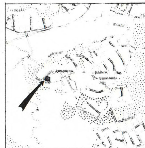
Översiktskarta Skala 1:20000.