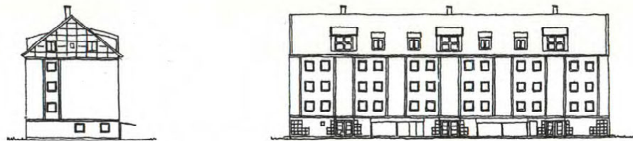
Fasaderna efter ombyggnad