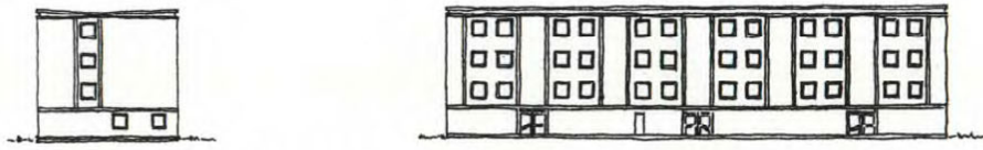
Befintliga hus fasader