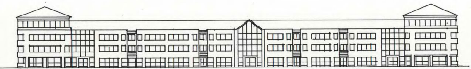
BYGGNAD A Förslag till fasadutformning