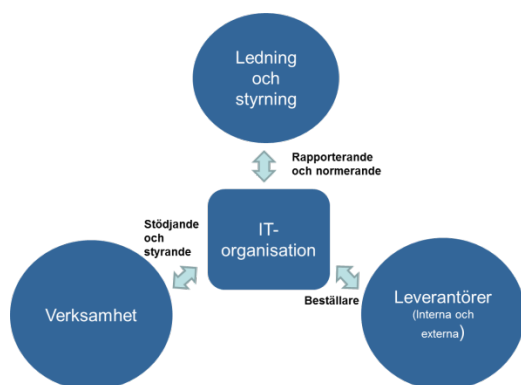
Bild 2. Konceptuell illustration över IT-organisationen

Enheten etableras successivt under 2014 och synkroniseras arbetsrättsligt med den pågående översynen av stabsorganisationen samt den pågående upphandlingen av IT.