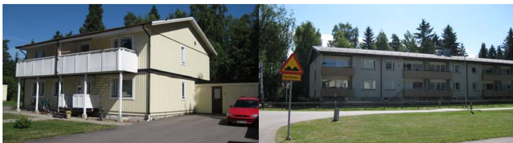
Vänster bild: Byggnader på planområdets västra sida, som är bostadsrätter. Höger bild: Byggnad snett mittemot planområdet, som är hyresrätter. Röda markeringar på utsnitt ur karta (höger kartbild) visar ungefärliga fotopunkter.