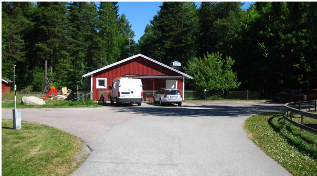
Planområdet och den befintliga byggnaden sett från söder. Röd markering på utsnitt ur karta (vänster kartbild) visar ungefärlig fotopunkt.

Planområdet gränsar i norr och öster till parkmark.