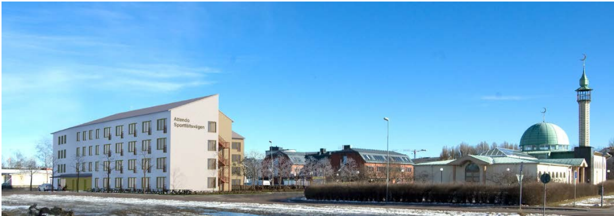
Illustration över möjlig bebyggelse sedd från Lötens sportfält.