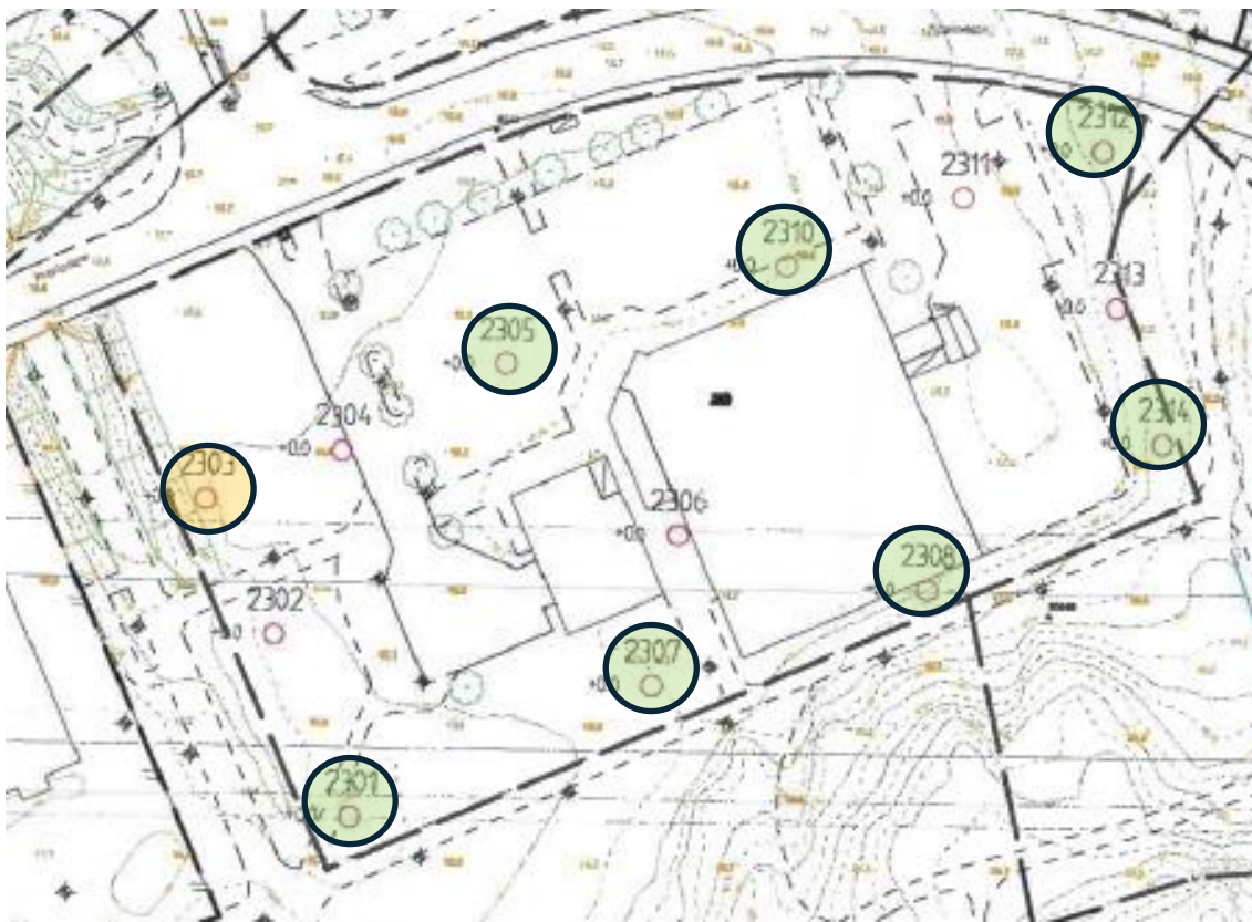
Figur 4. Borrpunkter. Analyser avseende markföroreningar har utförts i svartmarkerade provpunkter. Lätt förhöjda halter har påvisats i 2303 (orange färg).

Sammanlagt 39 jordprover togs ur 14 provpunkter. Jordproverna uttogs ur provpunkterna efter jordlagerföljd eller halvmetersvis ner till naturlig jord (lera) ner till 3 meter under markytan. Lägen för provpunkterna redovisas i Figur 4 .