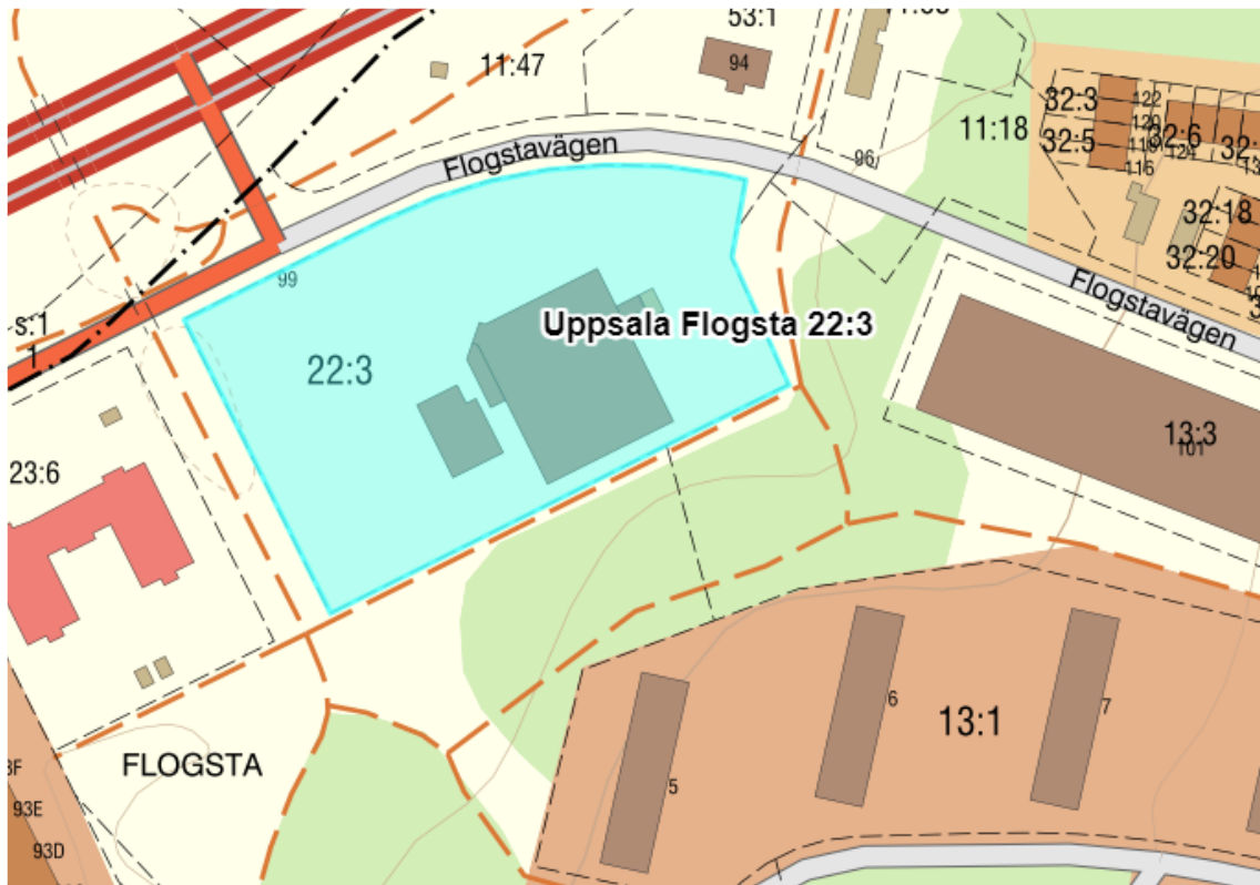
Figur 1. Fastigheten Uppsala Flogsta 22:3 som ingår i planområdet.

Relement Miljö Väst AB har på uppdrag Noll Tre konsult AB genomfört en översiktlig miljöteknisk markundersökning inom Flogsta 22:3 i Uppsala kommun, se Figur 1 nedan. Fastigheten ingår i planläggningen för kvarteret Stave. Syftet med ny detaljplan är att komplettera området med nya bostäder i varierande boendeformer. Befintlig bebyggelse består av ICA supermarket, återvinningsstation och parkeringsplatser.