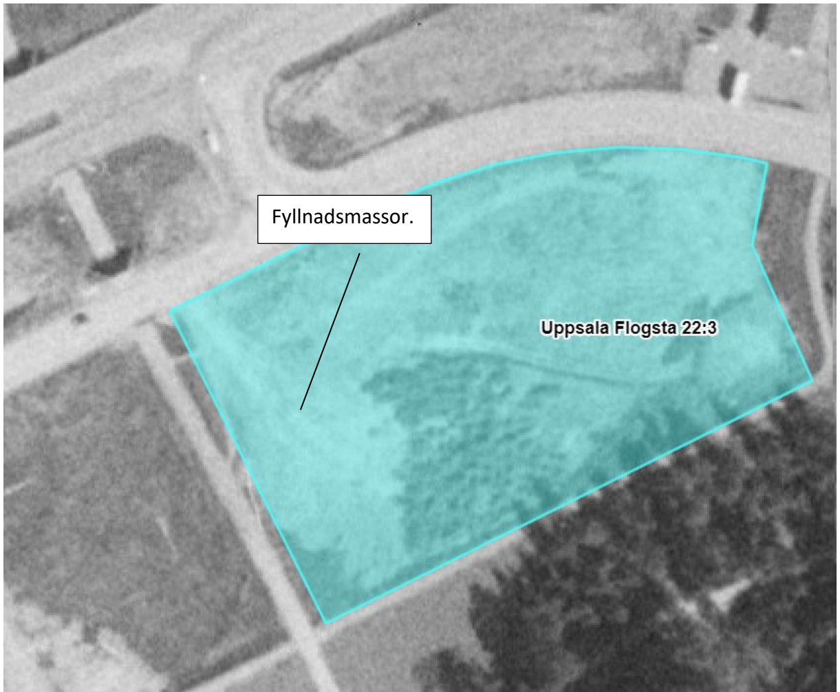
Figur 3. Området skissat på en historisk flygbild från 1970-talet. Området var skogs-och åkermark. Utfyllnader för blivande byggnation syns i västra delen.