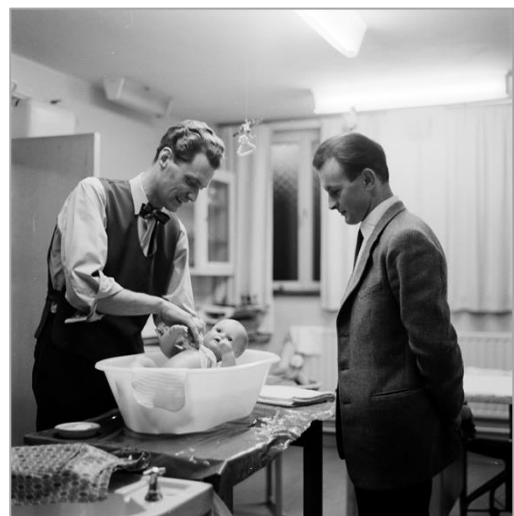
Höger: Pappor på barnskötkurs i barnstugans källare 1957.

Trots de stora förändringar som skett i det tidigare pensionärshemmet är barnstugan alltjämt mycket välbevarad. Inga mer omfattande förändringar har gjorts vare sig i exteriören eller i planlösningen. Vid sidan av att byggnadens ursprungliga arkitektur bevarats så finns också betydelsefulla detaljer som dörrar, fönster och öppna spisar kvar. Loggian har till en mindre del byggts in men det ursprungliga utseendet är fullt möjligt att återställa då ingenting rivits eller förstörts. Till följd av detta är byggnadens arkitektoniska och byggnadstekniska värden höga.