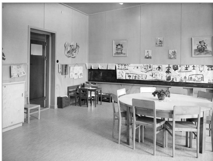
Vänster: Ett av rummen i barnstugan fotograferad 1947.

Barnstugan är den andra i Uppsala som uppfördes i kommunal regi och den har bibehållit sin funktion ända till 2020. Den första uppfördes sex år tidigare, 1939, och ligger i kvarteret bredvid, fortfarande i bruk som förskola. Tillsammans står de två byggnaderna som symboler för en viktig del av det svenska välfärdssamhällets historia: den svenska barnomsorgen och de gifta kvinnornas möjligheter att kunna förvärvsarbeta. De två barnstugorna blev tillsammans med barn- och mödravårdscentralen centrum för den tidiga barnomsorgen i Uppsala vid slutet av 1940-talet. Det medför mycket höga social- och samhällshistoriska värden.