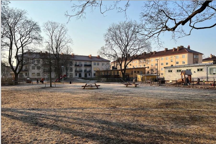
Eskilsplan med brf Fålhagslund till vänster, barnstugan i mitten och gamla barnstugan till höger. Snett bakom till höger syns också de samtida bostadshusen i kvarteret Nils.