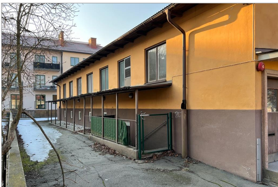
Barnstugans fram- och baksida. På baksidan finns ett sekundärt skärmtak som även skyddar källartrappan.