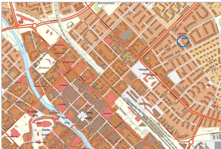
Karta över centrala Uppsala med fastigheten Fålhagen 15:2 inringad med blått. Karta från www.lantmateriet.se 2022-03-12.

Fastigheten Fålhagen 15:2 ligger i kvarteret Eskil i Fålhagen, nordost om centrum, med adressen Eskilsgatan 11. Den aktuella delen av fastigheten, det vill säga planområdet, omfattar cirka 1 000 m 2 och utgör fastighetens nordvästra del.