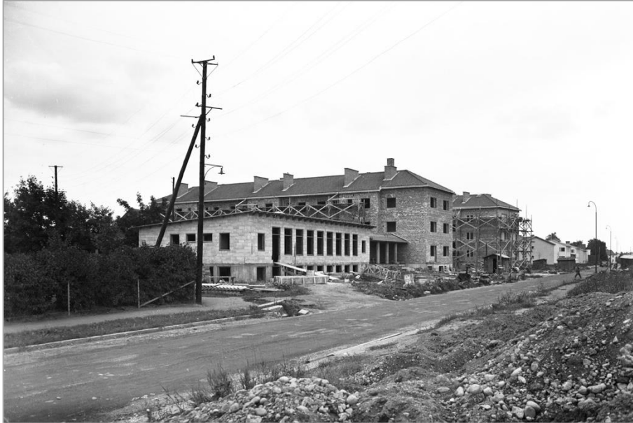
Kvarteret Eskil med barnstugan och pensionärshemmet under uppförande 1945.

Fastigheten förblev oförändrad till 1980 då de två bostadshusen byggdes samman med en länkbyggnad huvudsakligen i en våning. Här inreddes en ny matsal jämte klubbrum och en expedition. Barnstugan lämnades däremot utan ändringar. Ansvarig arkitekt var Wikforss Arkitektkontor i Uppsala.