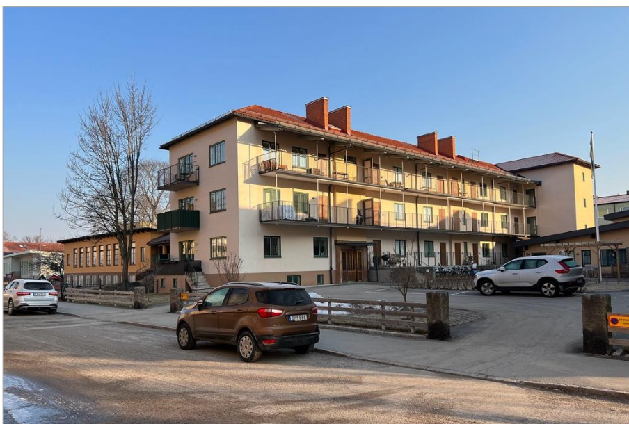
Det före detta pensionärshemmet som det ser ut idag. Sedan 2016 ägs det av bostadsrättsföreningen Fålhagslund och innehåller konventionella bostäder. Barnstugan syns till vänster.

2016 genomfördes ytterligare en omfattande ombyggnad av bostadshusen. Denna gång efter ritningar av a-sidan arkitektkontor i Uppsala. Anledningen var att fastigheten omvandlades till bostadsrättsföreningen Fålhagslund. Invändigt byggdes bostäderna om och utvändigt tillkom loftgångar och balkonger. Men även denna gång lämnades barnstugan utan förändringar. Tvärtom stannade förskolan kvar ända fram till 2020. Det gör att barnstugan behöll sin ursprungliga verksamhet i 75 år.