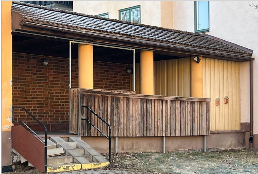
Loggian var ursprungligen öppen men har delvis byggts in med ett förråd och ett räcke. Båda bör tas bort vid en framtida renovering så att de runda pelarna återigen blir fristående.