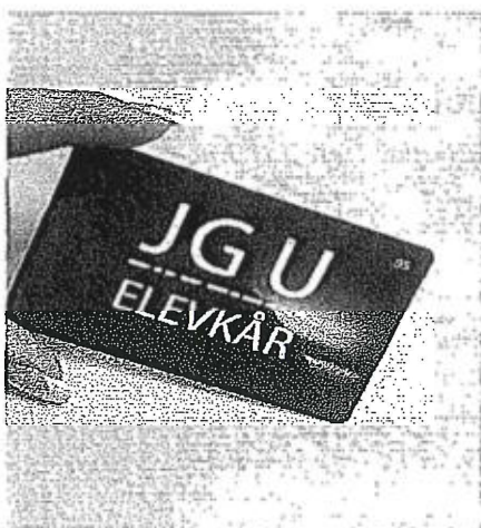
Jensen Uppsalas Elevkårs snygga medlemskort