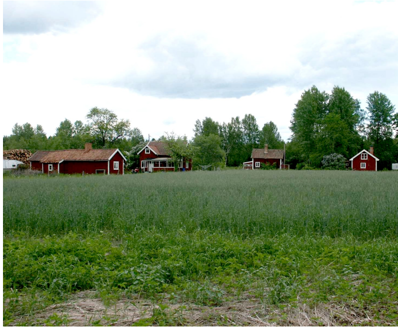
Bebyggelsen vid "gamla" Hagalund (sett från söder).