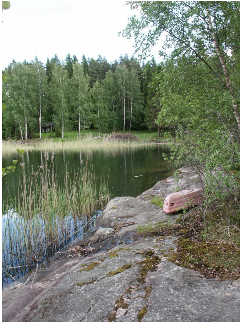
Sandbrovikens södra del. Klippstranden i förgrunden ingår i det område som är betecknat med Natur på plankartan (sett från norr).

Hagalundsområdet är väl försörjt med platser för rekreation – såväl inom som utom planområdet. Bland annat finns skogsområden med fina promenadstråk och Långsjön med stränder för bad och båtliv.