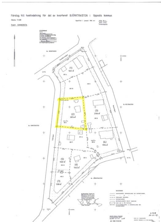
Sunnersta 105:1 gulmarkerad i tomtindelningsplanen.