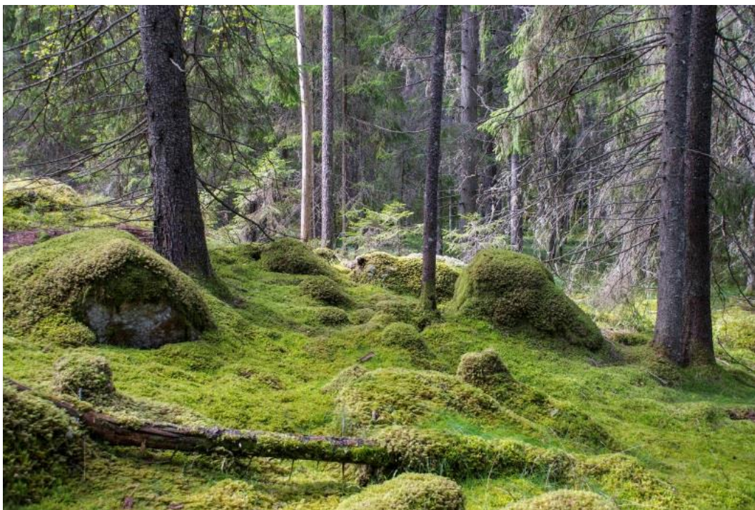
Område A. Mossrik granskog.