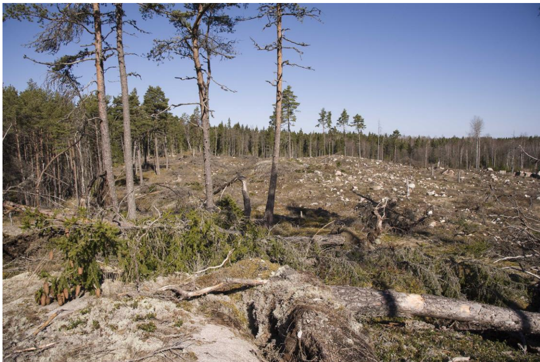
Område D. Nytt hygge som inte planterats.