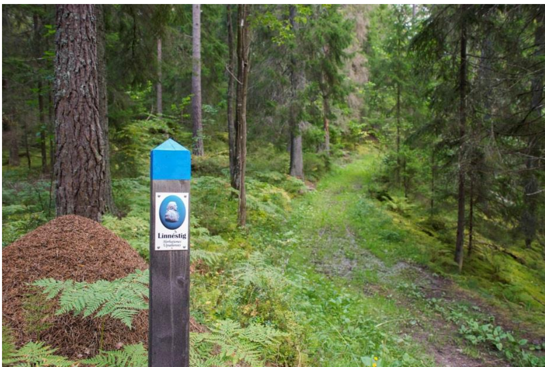
Område A. Linne'-stigen.