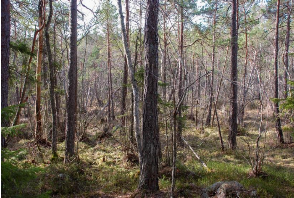
Område C. Trädbevuxet kärr.