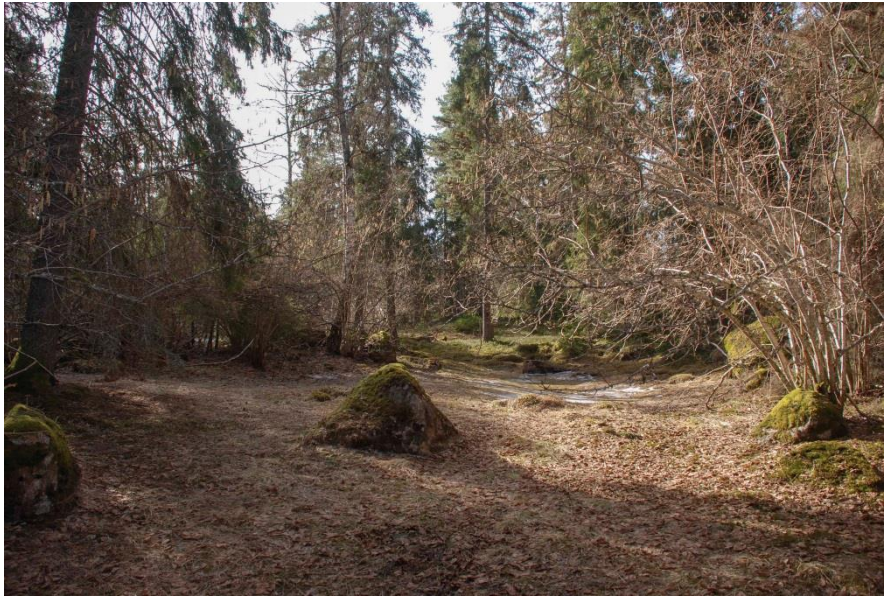
Område B. Glup omgiven av hassel och lövträd.