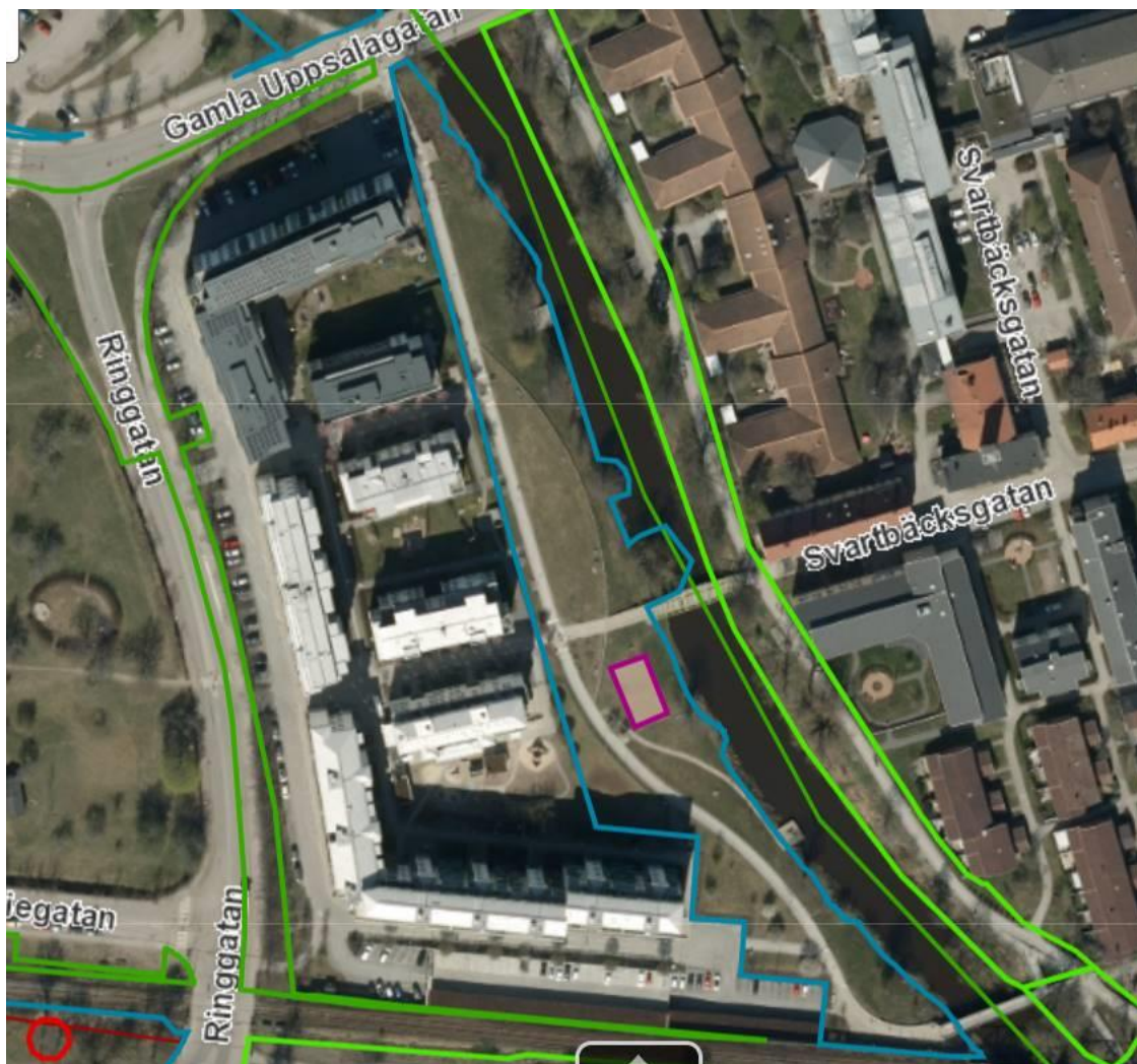
Bild på park inom Fyrsvallen intill Idunspången.