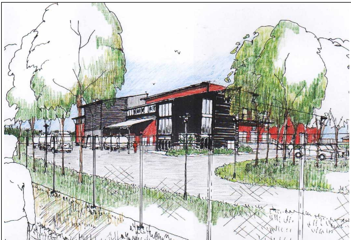
Vy från nordost, infarten från Bäcklösavägen i förgrunden.