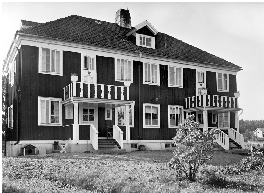
Gåvstagården, fasad mot norr med de ursprungliga entréerna. 1970 © Upplandsmuseet.

Ålderdomshemmet i Gåvsta byggdes innan den sociala reformen och med ritningar som låg till grund för Fattigvårdsstyrelsens typritningar. Byggnaden bedöms därför ha ett stort samhällshistoriskt värde.