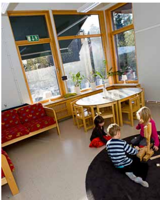
Rum med bra dagsljusinsläpp som även är försett med markis utvändigt.

Rum där barn vistas mer än tillfälligt, till exempel lekrum och matrum, ska ha god tillgång till direkt dagsljus. Fönsterytan bör vara minst 10 procent av golvytan. Barnen bör även ha möjlighet till utblick. Det innebär att källarlokalerna i allmänhet är olämpliga för barnomsorg.