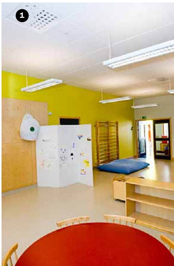
Tilluftsdon (1) och högt i tak ger förutsättningar för en bra luftomsättning. Det blir också enkelt att möblera lokalerna när tilluftsdonen är placerade i taket.

Luften i en lokal förorenas kontinuerligt av människor, byggmaterial och inredning med mera. Dålig ventilation kan ge upphov till bland annat allergiska besvär, huvudvärk, trötthet, klåda och irritationer i ögon och luftvägar. För att minska risken för hälsobesvär ska ventilationen vara anpassad för befintlig verksamhet och regelbundet skötas om. Ventilationens luftflöden ska vara anpassade efter hur många personer som vistas i byggnaden, men även till hur många personer som vistas i varje rum.