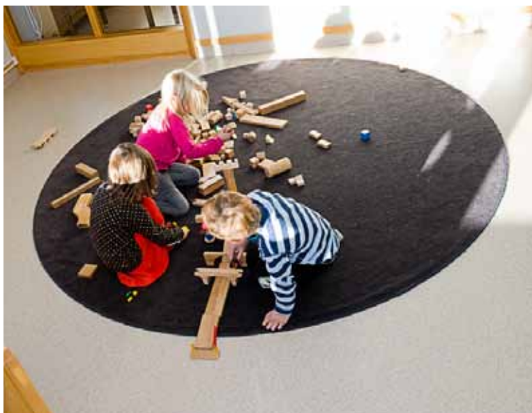
Lek på mjukt underlag (ex. matta) dämpar buller när barnen leker. Dock viktigt att det finns bra städrutiner för textilierna.

Kontinuerliga ljudnivåer från installationer – exempelvis ventilation – ska inte överstiga 30 dBA i lokalen. Dessutom finns det riktvärden för lågfrekvent buller i lokalen.