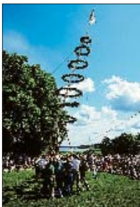
Midsommarfirande vid herrgården