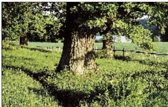
Några av Torans gamla ekar

Längst i öster mot Ekoln ligger Vreta udd med sina berg-hällar, ängar och lundar av ek, alm och lind. En fin plats där du kan sitta och njuta av solnedgången och stillsamt grilla din korv.