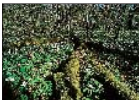
Vår i lunden vid Vreta udd