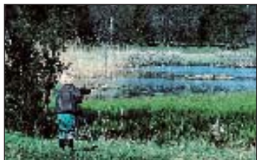
Ung fågelskådare vid Dalkarlskärret

Det skogsomslutna Dalkarlskärret har ett rikt fågelliv med många häckande fågelarter. Från fågeltornen kan du bl a skåda gräsänder, vigg, krickor och sothöns. Även i Dalbyviken är fågellivet rikt. Har Du tur kan du höra rördrommen tuta i vassen och näktergalen smattra i lövträden.