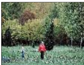
Svamplockare i Toran