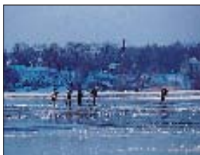
Skridskoåkning på Dalbyviken