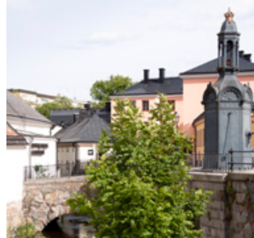
S:t Eriks källa. Över källan restes på 1850-talet ett pumphus tillverkat i gjutjärn av Hällefors bruk.

Enligt legenden dödades kung Erik Jedvardsson den 18 maj 1160 vid den plats där domkyrkan ligger nu. Han överraskades efter mässan av den danska prinsen Magnus Henrikssons knektar. Vid striden blev Erik halshuggen. Huvudet rullade nedför Domberget mot Fyrisån. Där det stannade och blodet rann ner sprängde genast friskt källvatten fram, nuvarande S:t Eriks källa.