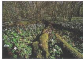
Vår i lunden vid Vreta udd