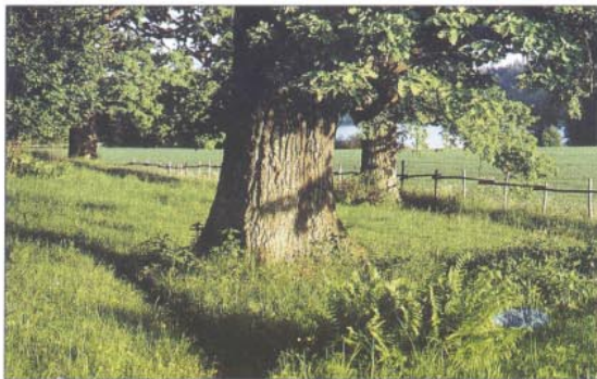
Några av Torans gamla ekar

Längst i öster mot Ekoln ligger Vreta udd med sina berg-hällar, ängar och lundar av ek, alm och lind. En fin plats där du kan sitta och njuta av solnedgången och stillsamt grilla din korv.