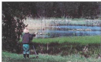
Ung fågelskådare vid Dalkarlskärret

Det skogsomslutna Dalkarlskärret har ett rikt fågelliv med många häckande fågelarter. Från fågeltornen kan du bl a skåda gräsänder, vigg, krickor, sothöns och inte minst Upplands största skrattnåskoloni. Även i Dalbyviken är fågellivet rikt. Har Du tur kan du höra rördrommen tuta i vassen och näktergalen smattra i lövträden.