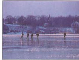
Skridskoåkning på Dalbyviken