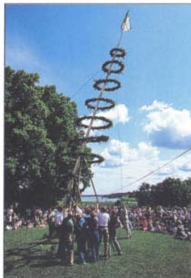
Midsummerfirande vid herrgården