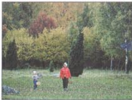
Svampplockare i Toran